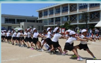
力の入った 全校綱引き