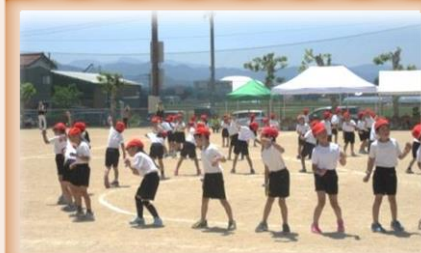
1,2年団演 ふふふふふふふ ふふつっ子ダンス