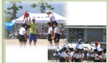
5,6年団競 天下分け目の戦い