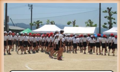
5,6年団演 集団行動 心を一つに