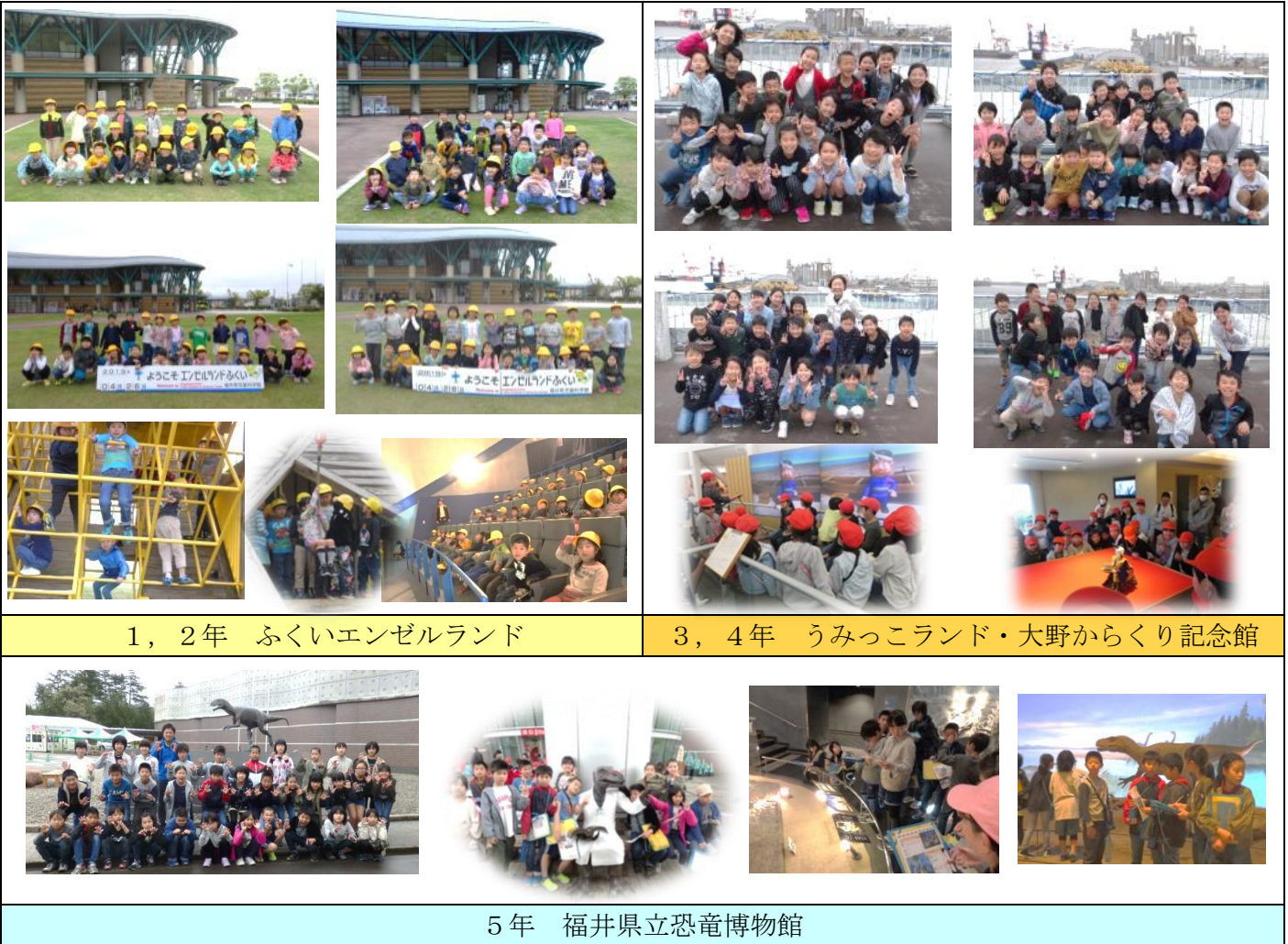
1, 2年 ふくいエンゼルランド