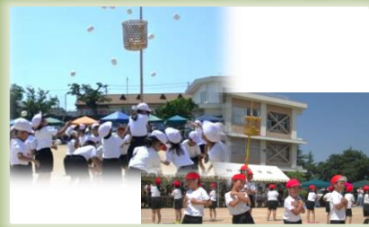
1,2年団競 チェッコリ玉入れ