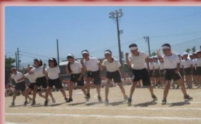
お互い熱のこもった応援合戦