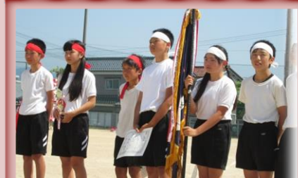
今年の優勝は白団