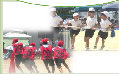
3,4年団競 符津っ子タイム