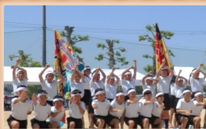
3,4年団演 符津っ子ソーラン