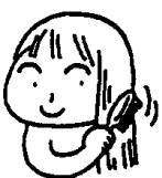
Escovar os cabelo para tirar a sujeira e a gordura capilar