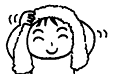
Vamos enxugar bem com toalha limpa