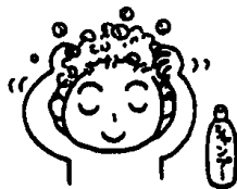
Lavar e massagear bem com xampu o couro cabeludo