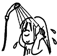
Retirar a sujeira com ducha quente