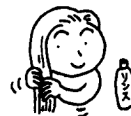
Passar condicionador enxaguar bem.