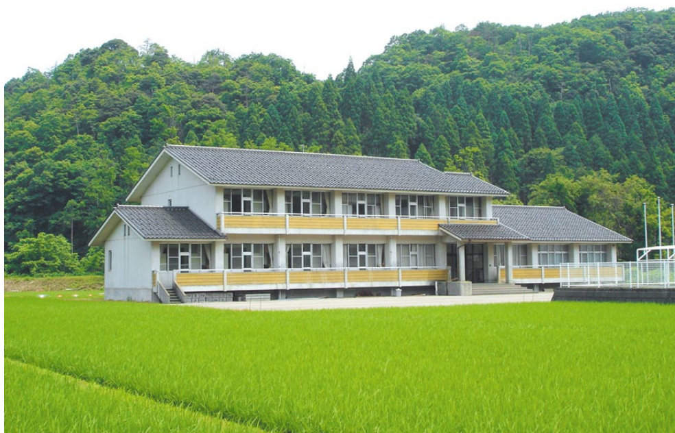
松東中学校寄宿舎 睦習館

主催／小松市立松東中学校 松東中学校スクールキャンプ実行委員会 後援／小松市教育委員会